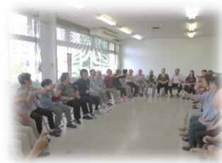
【笑って動いて元気に脳トレ】