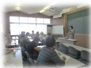
【正しく頂くための食事マナー】