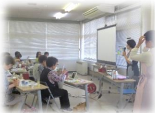
【素肌キレイレッスン】

新年度が始まりたくさんのお申し込みをいただいております。新たに様々なジャンルの講師の方々に登録いただき、さらにパワーアップしました。是非、研修を通して、受講していただけましたら幸いです。